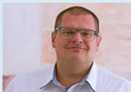
Podpora výzkumu a vzdělávání jako cesta Strana 2