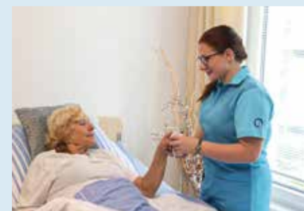
SeniorCentrum Kolín a Liberec nabízejí odlehčovací službu Strana 8