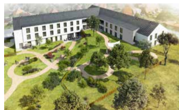
Vizualizace domova v Chotěboři

vých sociálních služeb, které v Horažďovicích a okolí doposud chybí. Projekt, který se již chýlí ke svému dokončení, je pak SeniorCentrum v Chotěboři – svoje klienty přivítá už v prvním kvartálu roku 2021.